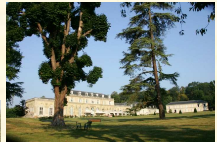
Le château du Val à St-Germain-en-Laye