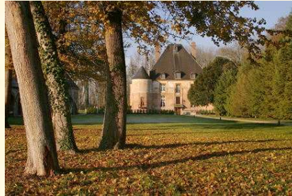
Le château de Pouy dans l'Aube

Elles accueillent aussi bien les personnes à l'année que les vacanciers.