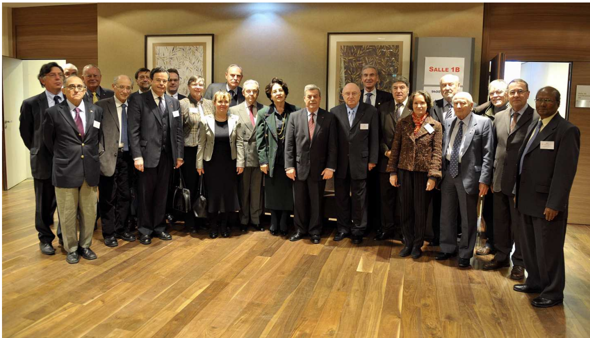
La commission des Anciens Combattants réunie autour des généraux Hervé Gobillard et Alain Picard