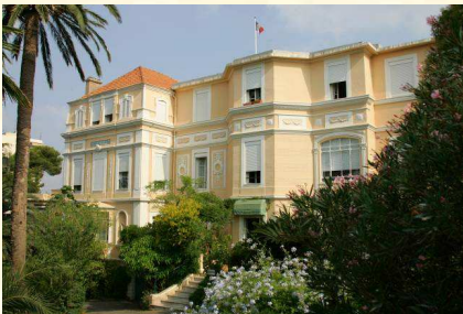
La résidence de Costeur-Solviane à St-Raphaël

Ces lieux permettent, également, d'organiser tous types d'évènements : mariages, repas d'associations, de familles, d'affaires et d'organiser des séminaires professionnels.