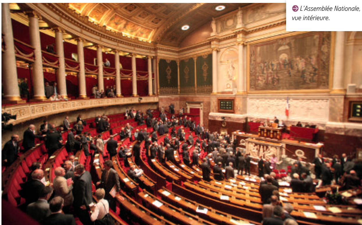
➔ L'Assemblée Nationale, vue intérieure.

Un projet de loi de ratification de ces ordonnances devrait être présenté au Parlement d'ici la fin de l'année 2009.