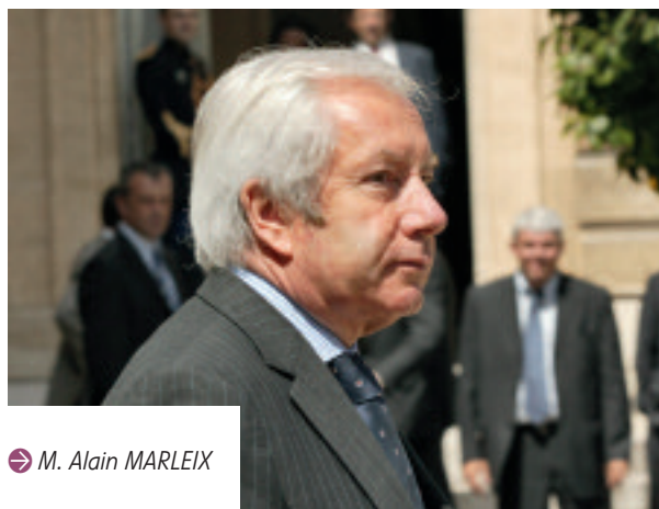
➔ M. Alain MARLEIX

Le secrétaire d'État à l'Intérieur et aux Collectivités territoriales, M. Alain MARLEIX, est intervenu le 6 mars au sujet de la réforme en cours relative à l'élection, à partir de 2012, des députés représentant les Français établis hors de France. Il a confirmé que ces élus de la Nation seront, comme leurs collègues de métropole et d'outre-mer, élus au scrutin uninominal majoritaire à deux tours. Le secrétaire d'État a souligné la nécessité d'adapter l'organisation de ce scrutin aux réalités de l'étranger. En particulier, il s'est entretenu avec l'assemblée des conditions permettant une large participation à ces élections.